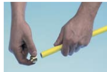
Нанизывание пресс-втулки на трубу.