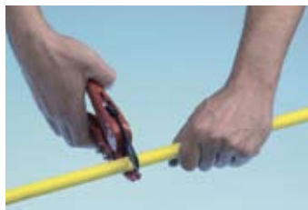
Обрезка трубы при помощи труборезных ножниц.

Соединения трубопроводов диаметрами до 32 мм могут выполняться при помощи ручного инструмента, а диаметрами от 40 до 63 мм только электропрессовым инструментом с использованием специальных насадок TECE.